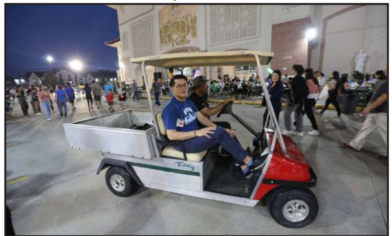
Nhân viên phục vụ phải đặc biệt mới hơn người!