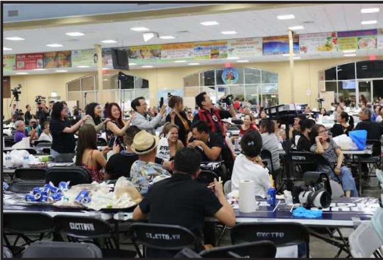
Tạ ơn Chúa đã cho chúng con 2 ngày tuyệt vời