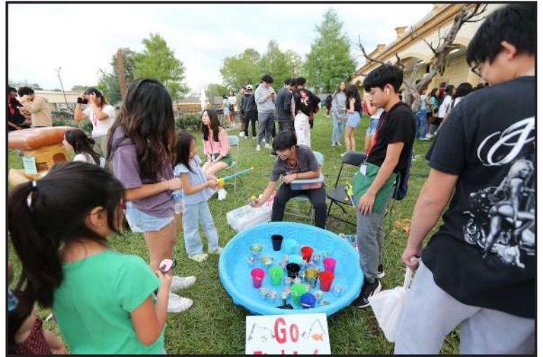
Không vui không lấy tiền!