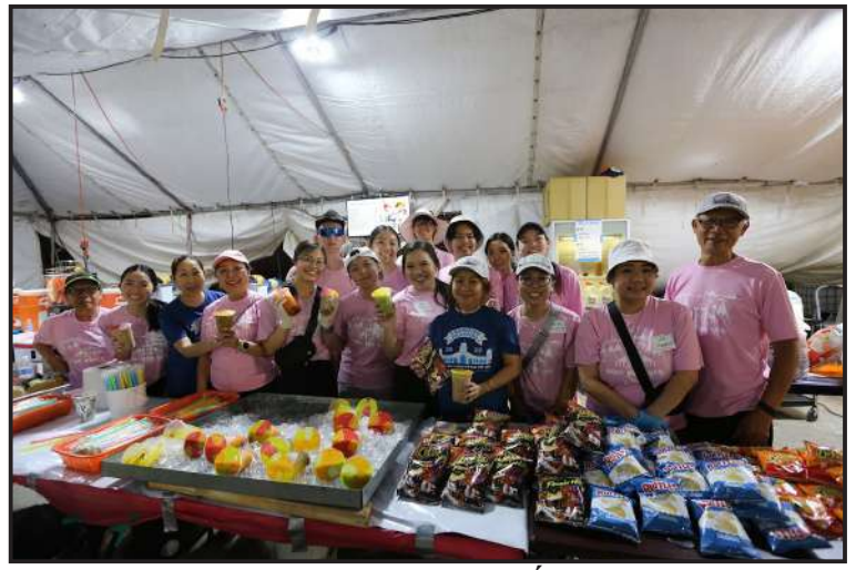
Có ăn phải có uống