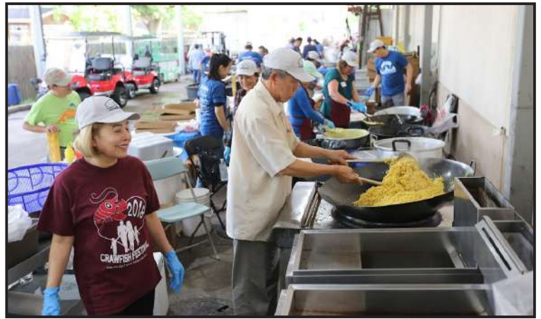
Mọi người đã sẵn sàng chưa?