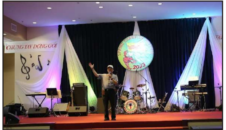
Cha Xứ tuyên bố khai mạc